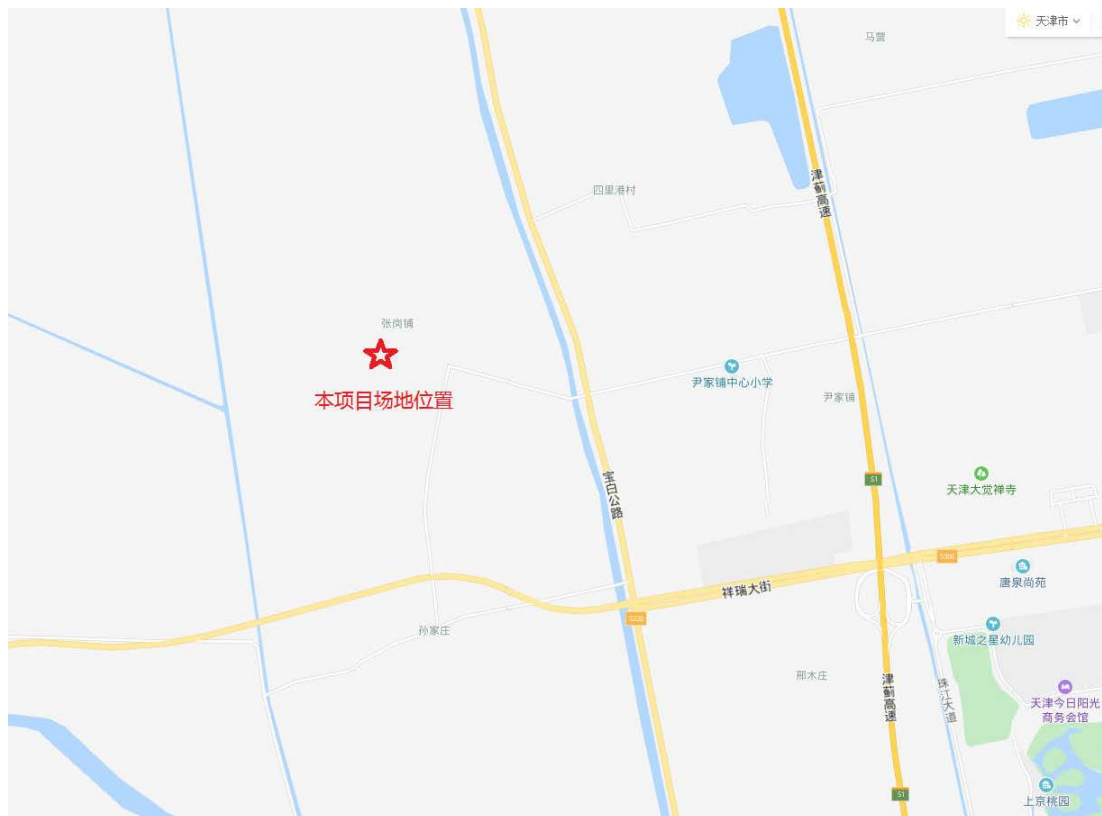
图 1.2-1 地块位置示意图

本次所调查场地四至范围为：东至宝坻区周良街道张岗铺村，南至宝坻区周良街道张岗铺村，西至宝坻区周良街道张岗铺村，北至宝坻区周良街道张岗铺村，具体位置见图 1.2-1。本地块调查范围见图 1.2-2，地块主要拐点坐标（天津 90 直角坐标系）如表 1.2 所示。本次调查采用的高程系统为天津 1972 年大沽高程系（2018 年成果）。