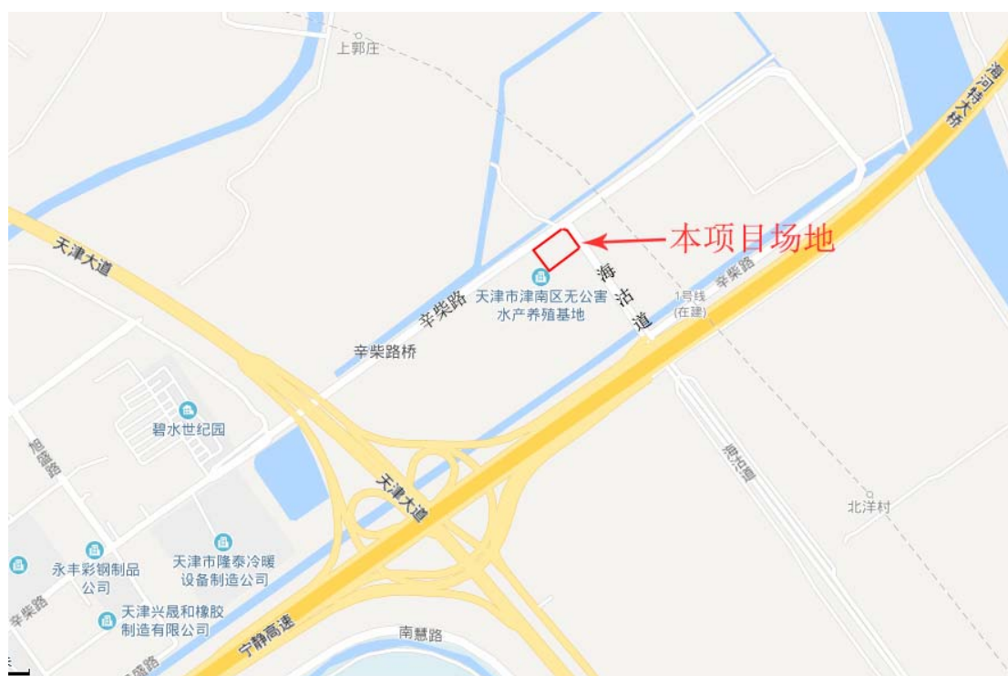
图 1.2-1 地块位置示意图

本次所调查场地四至范围为：东至海沽道，南至规划会展中心轮候区用地边界，西至辛柴路 110KV 变电站边界，北至辛柴路，具体位置见图 1.3-1。本地块核定用地地图见图 1.3-2，调查范围见图 1.3-3，地块主要拐点坐标（天津 90 直角坐标系）如表 1.3 所示。本次调查采用的高程系统为天津 1972 年大沽高程系（2018 年成果）。