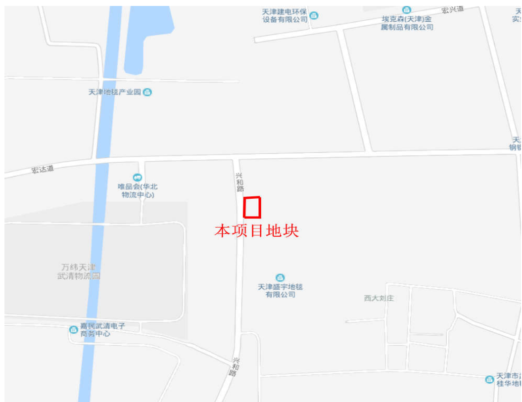
图 1.2-1 地块位置示意图

本次所调查场地四至范围为：东至东至现状水塘，南至现状空地，西至兴和路，北至宏达道南侧道路绿线（距离宏达道道路红线约 103.5m，该区域现状为街边公园），具体位置见图 1.3-1。本地块核定用地地图见图 1.3-2，调查范围见图 1.3-3，地块主要拐点坐标（天津 90 直角坐标系）如表 1.3 所示。本次调查采用的高程系统为天津 1972 年大沽高程系（2018 年成果）。